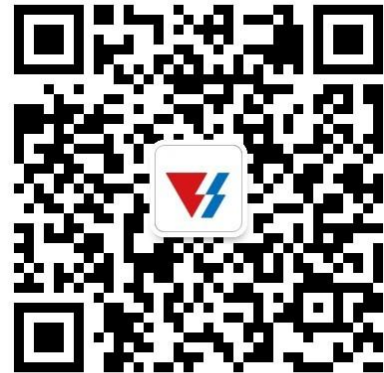
天能校园招聘“微信公众号”